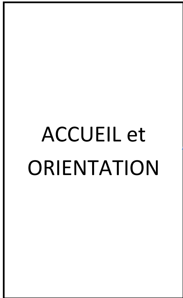
Schéma de l'offre