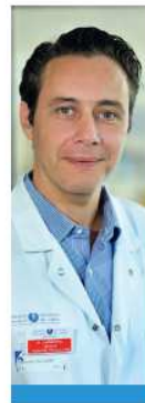
Pr Jérôme Larghero, responsable de l'unité de Thérapie Cellulaire de l'hôpital Saint-Louis