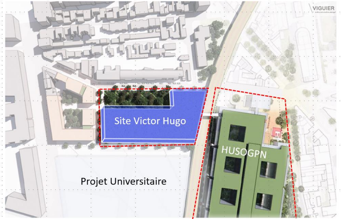
Site Victor Hugo